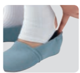
表:綿95%、ポリウレタン5% 内:綿95%、ポリウレタン5% 底材:ナイロン60%、ポリウレタン40% 重さ(片方Lサイズ):約60g

品番 2704 両足 3,960円 (税抜3,600円) 足囲 5E相当 片方のみ 1,980円 (税抜1,800円)