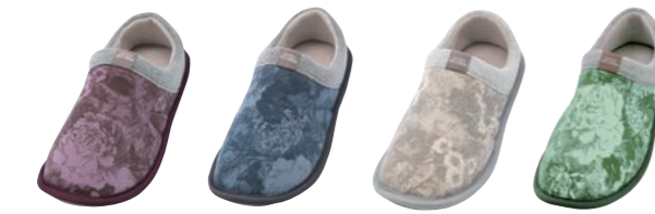
ラズベリー (ワイン柄)