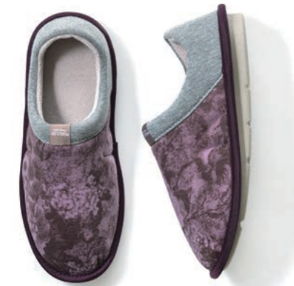
ラズベリー(ワイン柄)