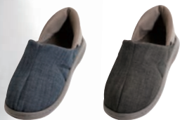
ネイビー ダークグレー