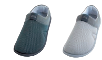
フォレストグリーン