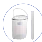
尿タンク・ブラシ入れが付属します。