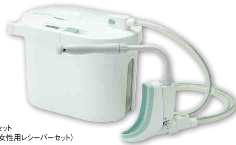
女性用セット （本体+女性用レシーバーセット）