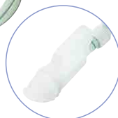
アタッチメントが付属します。