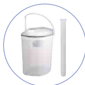
尿タンク・ブラシ入れが付属します。