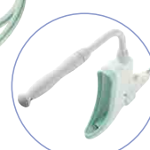
ハンドルが付属します。