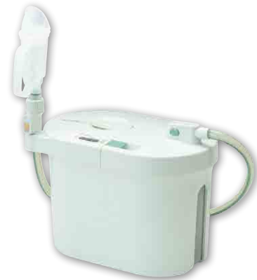
男性用セット （本体+男性用レシーバーセット）